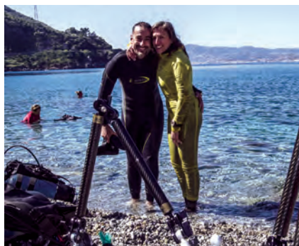
Salvatori con la sua modella, nonché moglie