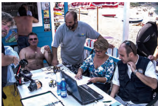
Il tavolo dei giudici di gara